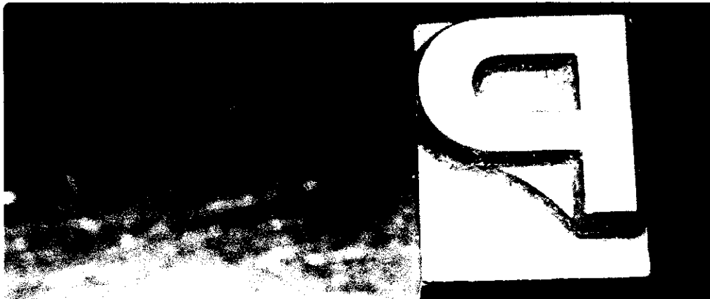
Print Press door Peter onder Attribution-ShareAlike 2.0 Generic licentie